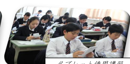
タブレット使用講習