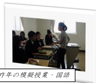
昨年の模擬授業・国語